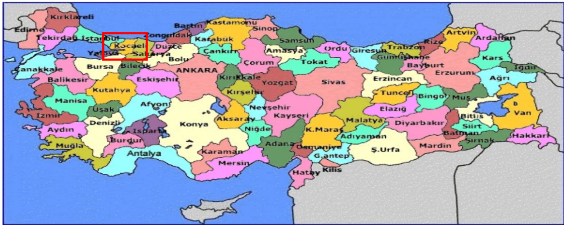
Harita 1 - Kocaeli'nin Konumu

Kocaeli'nin sanayileşmesinde en önemli etken, tüm ulaşım imkanlarına sahip olmasıdır. Kara ve demiryolu ağları ile yapılan taşımacılık özellikle Avrupa ve Ortadoğu'ya yapılmakta olup, limanlar ile yapılan deniz taşımacılığı da önemli bir boyuta ulaşmıştır. İstanbul ve Bursa gibi önemli ticaret ve sanayi merkezlerine yakınlığı, yatırımlar açısından Kocaeli'yi öncelikli kılmaktadır. Kocaeli'nin şehir merkezi İzmit'in İstanbul'a uzaklığı 85 km'dir. İstanbul'un batı yakasında bulunan Atatürk Hava Limanı ve doğusunda faaliyet gösteren hemen yakınındaki Sabiha Gökçen Havalimanı ile dünyaya açılan Kocaeli, Ankara'ya da TEM otoyolu ile bağlıdır. Uluslararası İstanbul Atatürk Havalimanı 97 km. mesafededir. Ayrıca Uluslararası Sabiha Gökçen Havalimanı'na 50 km. mesafededir. 5'i Kamu Limanı (Derince ve Yarımca) ve 35 özel iskele ile deniz ulaşımı imkanları açısından tüm Anadolu'nun en iç noktasındadır.